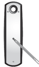
Donner une impulsion sur la touche « PROG » de l'émetteur