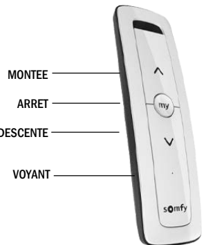
Télécommande RTS : led rouge IO : led verte