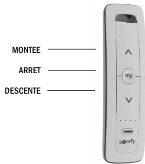
Télécommande RTS : led rouge IO : led verte