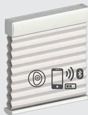
Manœuvre motorisée PowerView®