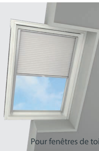
Pour fenêtres de toit