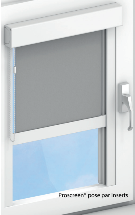
Proscreen® pose par inserts