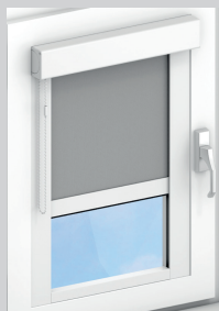
Proscreen® occultant Pose collée/clipsée